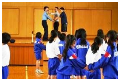
▲ 防犯教室で先生も一緒に(6/17)