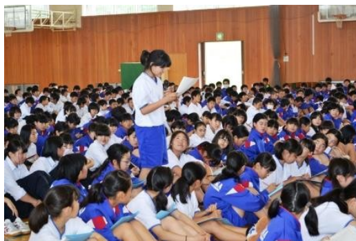
▲ 人権教育まとめ集会で意見を発表 (7/1)

で、翌日の「あゆみ」(生活記録)に、今の自分やクラスのことを振り返り、清掃や行事、休み時間の場面などを思い浮かべ、具体的に「こうしたい」という決意を書いていました。