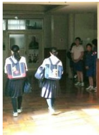
▲ 朝のあいさつ運動 (5/20)

「いじめを絶対許さない姿勢を貫いてほしい」という強いご要望や「墨中生はあいさつが良くできている」というお褒めのことばも頂戴いたしました。