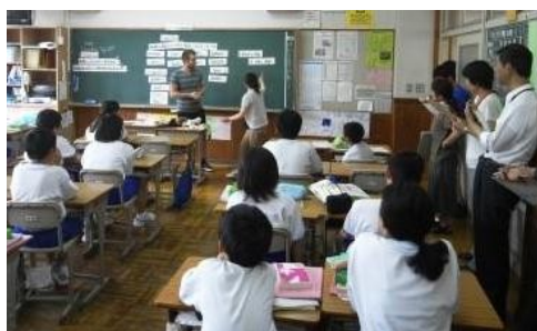
▲ 英語の全校研究(7/16 1年5組)