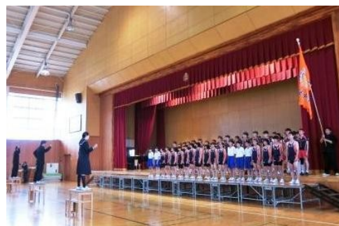
▲ 上高井大会の壮行会(6/5)

したのは、陸上部(男子・女子個人)、水泳部(男子個人・リレー)、卓球部(男子団体・男子個人)、バドミントン(女子個人)、柔道(男子・女子個人)でした。