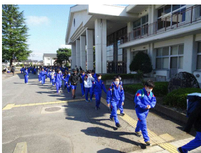
1学年「臥竜山に向けて出発」

「⑭生徒は、キャンプ、職場体験学習、修学旅行、文化祭などの行事を楽しみにしている」は、高評価となりました。生徒アンケートに答えた93.4%の生徒も「キャンプや修学旅行、文化祭などの行事は楽しみである」に肯定的に答えています。