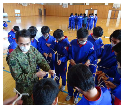
2学年「キャリア教育講演会」

令和3年度の妙高高原自然体験学習、職場体験学習、修学旅行については、時期を遅らせ、夏休み明けの2学期での実施を予定しています。