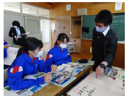
社会科研究授業での学びの姿

また、「③墨坂中学校は、命の大切さや仲間の大切さについてきちんと教えている。」の肯定的評価は、79.3%でした。生徒アンケートの「学校では、命の大切さや仲間の大切さについて教えてくれる。」の肯定的評価97.1%よりは低い数値ですが、概ね8割の肯定的な評価をいただいております。今後も、命の大切さや仲間の大切さについて考える機会を設け、生徒と共に考え、学び合う過程を大事にしたいと思います。