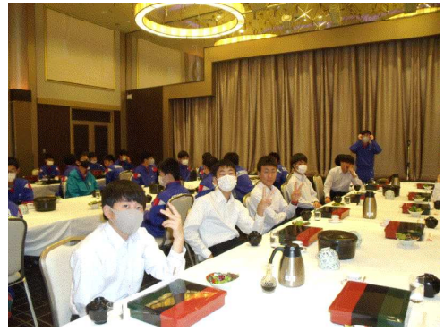
3学年「修学旅行での食事風景」

全19項目中、「①生徒は、学校に誇りを持ち、喜んで通学している。」「②学校生活において、生徒は互いに協力し、頑張っていることを認め合っている。」「⑦墨坂中学校の施設や環境は、教育環境にふさわしく管理されている。」「⑭生徒は、キャンプ、職場体験学習、修学旅行、文化祭などの行事を楽しみにしている」「⑮学校の教育方針や情報などが、学校日より、学年日より、学級日より等で保護者に分かりやすく伝えられている。」「⑱学校の新型コロナウイルス感染拡大防止のための対応は適切に行われている。」の項目が、80%を上回りました。